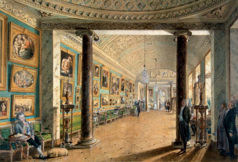
КАРТИННАЯ ГАЛЕРЕЯ Е. С. ГРАФА