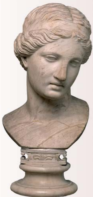
Женская голова. Италия. XVIII в. (?) Мрамор.

Художественные собрания графов Строгановых начали создаваться в тот момент, когда мода на античность в Европе и России достигла своего апогея. Изменение художественного вкуса и археологический бум, возникший после открытия в 1730–1740-х годах Геркуланума и Помпей, привели к повальному увлечению собирательством античных произведений искусства. В погоне за ними в Италию стекались коллекционеры из Германии, Франции, Англии и России. В течение XVIII века были сформированы крупнейшие и наиболее значительные античные собрания. В России это были императорские коллекции классических древностей Екатерины II и Павла I, а также собрания частных музеев русских аристократических фамилий – князей Юсуповых, графов Шуваловых, князей Голицыных.