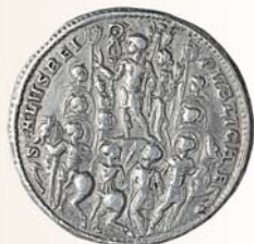
Медальон. Константин I Великий (307-337 гг.). Римская империя. Серебро. Аверс, реверс.