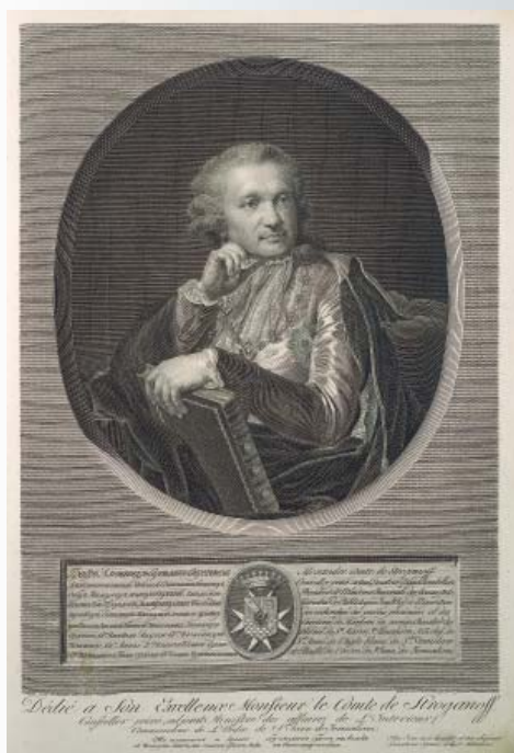
Граф А.С. Строганов. Санкт-Петербург. 1807 г. Художник И.С. Клаубер. Бумага, пунктир.