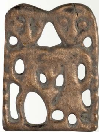
Пластина с изображением семьи.