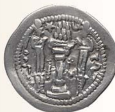
Драхма. Пероз I (459-483/4 гг.). Иран. Серебро. Аверс, реверс.