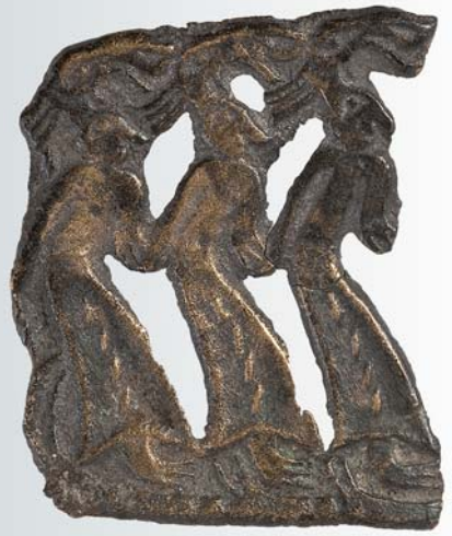
Пластина – три лосе-человека. VI-VII вв. Бронза, литье.

ней использованы зооморфный, антропоморфный, количественный, порядковый, пространственный коды. Кодовая система динамична, она пополняется по мере необходимости. Таким образом, для расшифровки знака необходимо определить, когда он появился в изобразительной деятельности, как широко распространен, – то есть фактически реконструировать генезис знаковой системы. Только тогда имеет смысл обращаться к вторичным историческим источникам: фольклорным, языковым, этнографическим материалам.