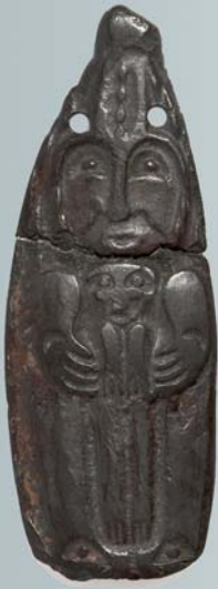
Пластина с изображением женщины с ребенком. VI-IX вв. Бронза, литье.