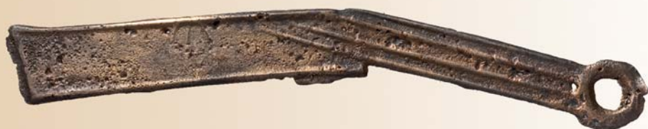
Монета-нож. Китай. Династия Чжоу. VI-III вв. до н.э. Медь.