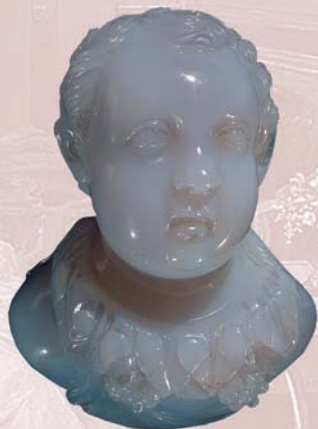
Бюст Анния Вера. Италия, Рим. 160-е годы. Халцедон.

шего дворец в начале XIX века: «В центре последней комнаты (Физический кабинет) сооружена печь, предназначенная для химических опытов и украшенная некими египетскими фигурами, а вдоль стен стоят шкафы, в которых хранятся почитаемые в северной России разные примечательные русские, и в особенности греческие и римские, древности». Однако основная часть археологической коллекции была сформирована значительно позже, в середине XIX века, стараниями Сергея Григорьевича и