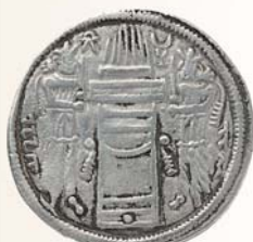
Драхма. Шапур II (309-379 гг.). Иран. Серебро. Аверс, реверс.