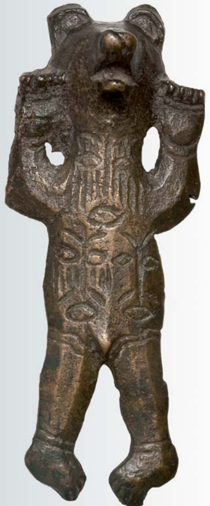
Фигурка медведя. VI-VIII вв. Бронза, литье.

Семантическая расшифровка изображений главного персонажа свидетельствует о кровном родстве зверя и человека, о происхождении от единого предка – зверя-человека. Расшифровка как отдельных персонажей, так и сложных сюжетных композиций чудских образков позволила ответить на вопрос о мировоззренческой основе искусства пермского «звериного» стиля. Основой, навечно запечатленной в металлической пластике, служила родовая система мировоззрения, родовый закон жизни.