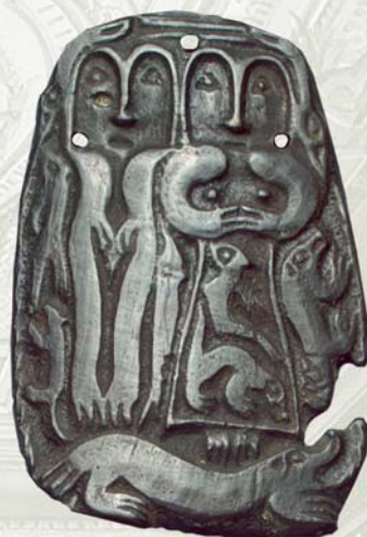
Пластина с мужской и женской фигурами лосе-людей на ящере.

Тема семьи в искусстве пермского «звериного» стиля представлена в чудских образках, найденных в различных местах