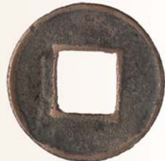
Монета «у-шу». Китай. II в. до н.э. – VII в. н.э. Медь.