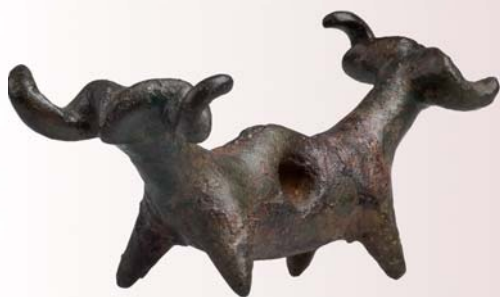
Подвеска «двойной баран». Италия, Пицен. VII век до н.э. Бронза.

Для Строгановых античность никогда не была основным предметом собирательства – как известно, главной ценностью дворца была картинная галерея. Однако уже Александр Сергеевич обладал небольшой, но изысканной коллекцией