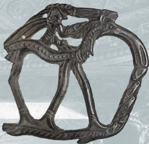
Пластина со всадником на лосе-человеке. VI-IX вв. Бронза, литье.

бывшей Пермской губернии. Один из примеров – бронзовая ажурная пластина с изображением семьи с р. Кемоль, где фигурки мужчины, женщины и ребенка между ними сильно стилизованы, без проработки конечностей.